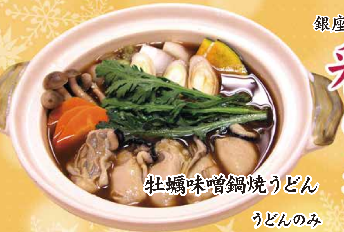
牡蠣味噌鍋焼うどん