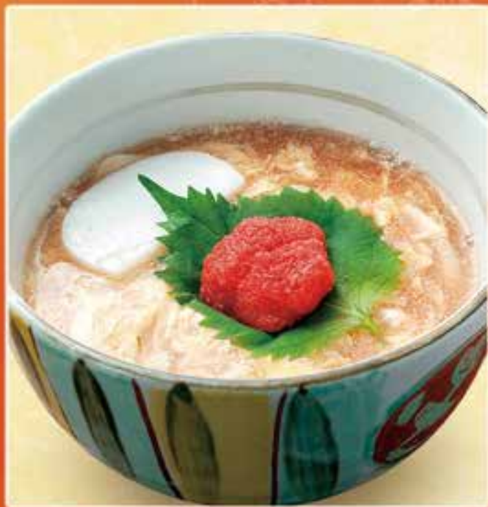
明太玉子とじ うどん・そば