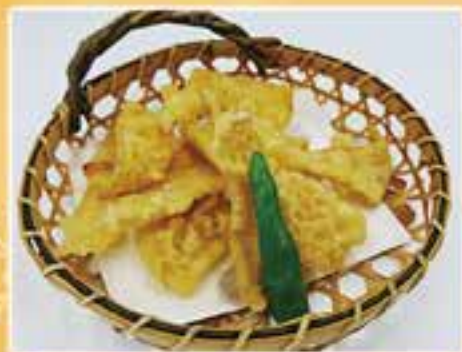
エイヒレの天ぷら