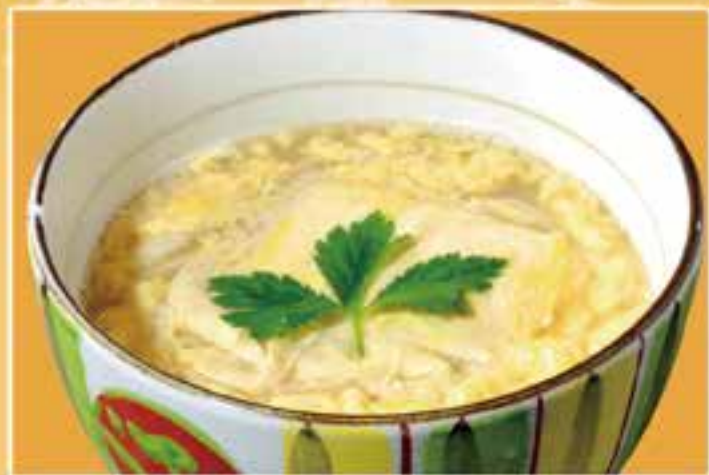
とろ湯葉玉子とじ