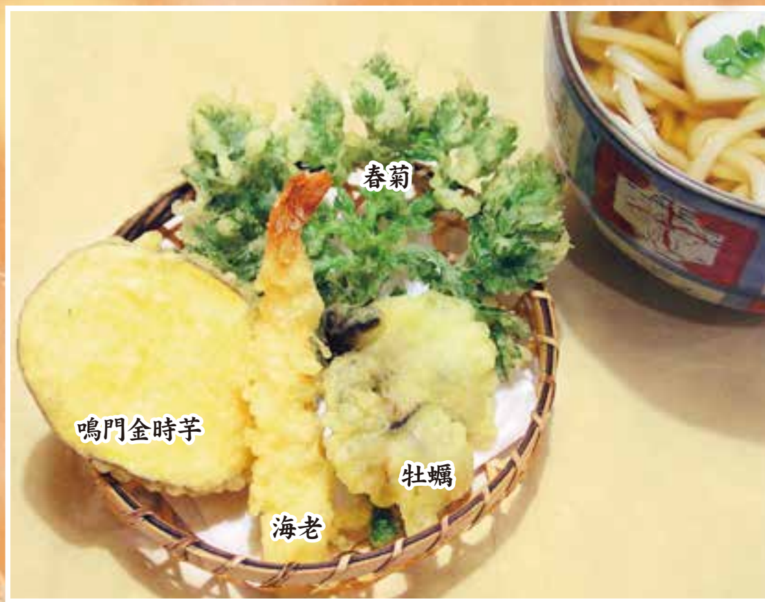
牡蠣のあんかけ うどん・そば