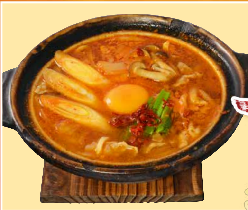
濃厚チゲ鍋風うどん うどんのみ