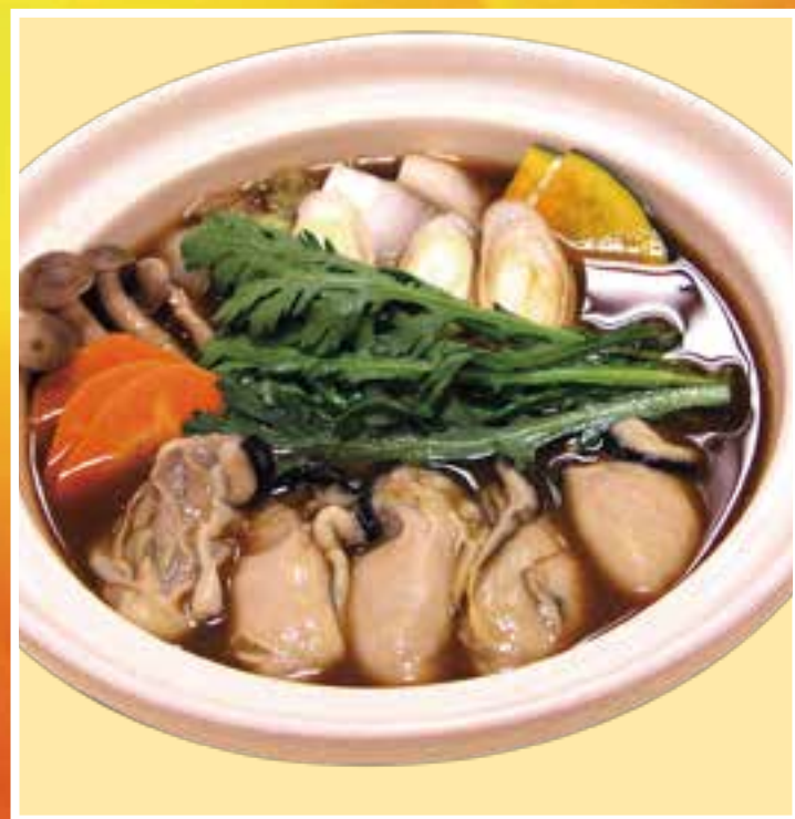
牡蠣味噌鍋焼うどん